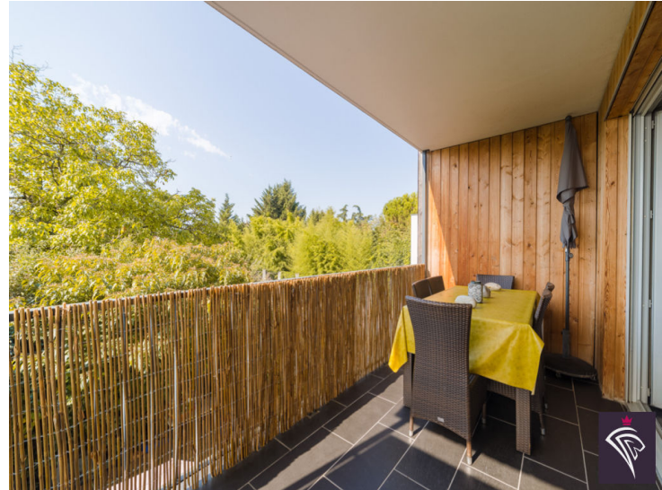
APPARTEMENT 4 PIÈCES AVEC TERRASSE

Venez découvrir cet appartement de 4 pièces de 90,23 m 2 , situé au coeur de Vaulx en Velin VILLAGE à deux minutes à pied de toutes commodités et transports.