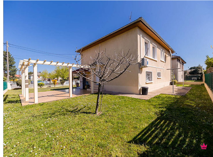
MAISON 5 PIÈCES AVEC SOUS-SOL

Venez découvrir cette maison de 5 pièces de 129 m 2 et de 564 m 2 de terrain.