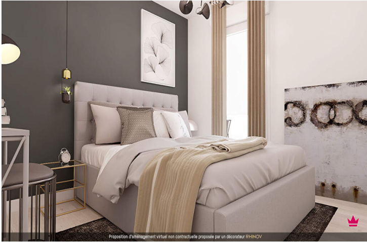
Proposition d'aménagement virtuel non contractuelle proposée par un décorateur RHINOV