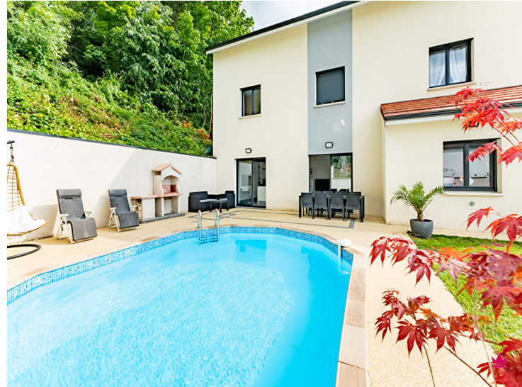
PROCHE DE LYON - MAISON DE 2018 - 9 PIÈCES AVEC PISCINE

Venez découvrir cette maison de 233,25 m 2 située à PONT DE CHERUY (38230).