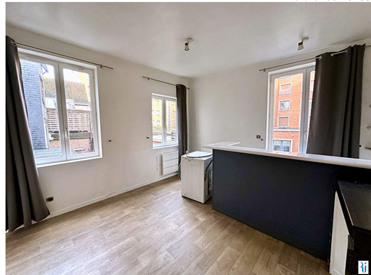
ROUEN VIEUX MARCHE Rue du Vieux Palais

SAUVAGE TRANSACTION VOUS PROPOSE EN EXCLUSIVITE UN APPARTEMENT TYPE 2 PIECES D'UNE SURFACE DE 31.25M 2 AU 1ER ETAGE D'UN PETIT IMMEUBLE AU CALME COMPRENANT :