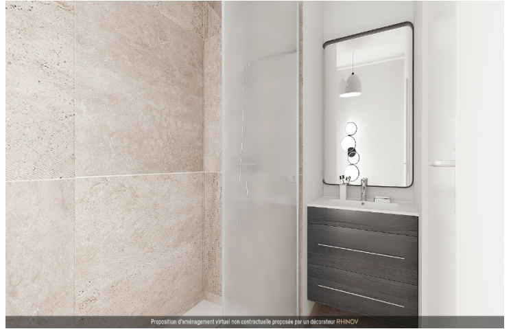
Proposition d'aménagement virtuel non contractuelle proposée par un décorateur RHINOV

D o c u m e n t n o n c o n t r a c t u e l