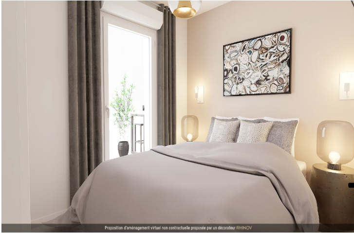
Proposition d'aménagement virtuel non contractuelle proposée par un décorateur RHINOV