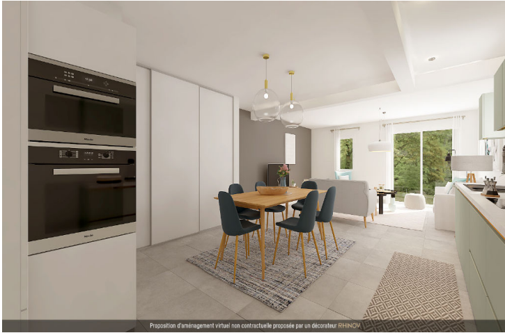
Proposition d'aménagement virtuel non contractuelle proposée par un décorateur RHINOV