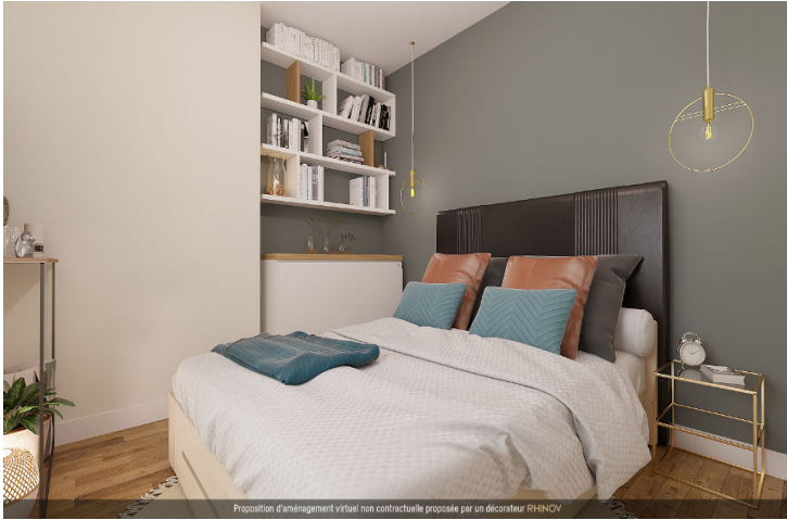
Proposition d'aménagement virtuel non contractuelle proposée par un décorateur RH-NOV

D o c u m e n t n o n c o n t r a c t u e l