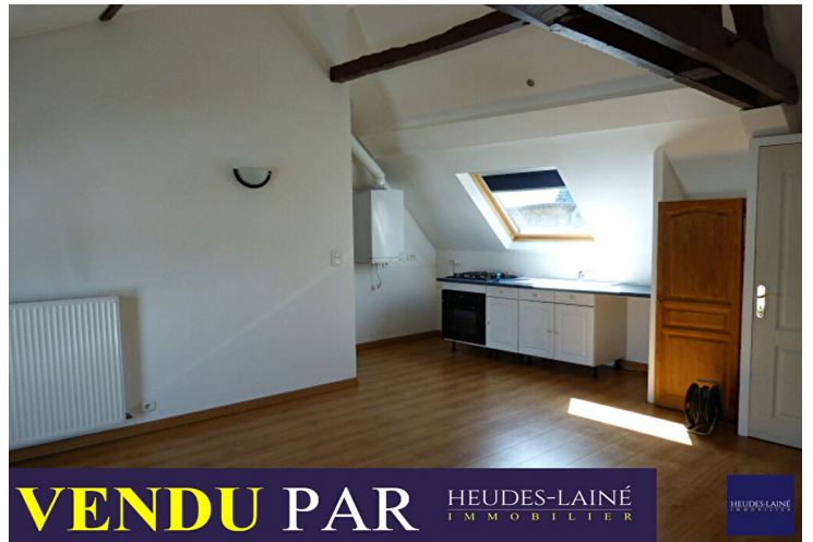
VENDU PAR HEUDES-LAINÉ IMMOBILIER