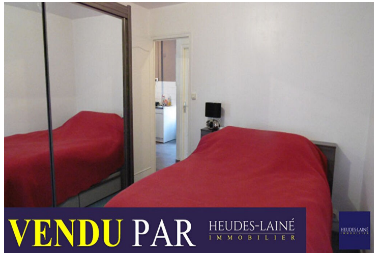
VENDU PAR HEUDES-LAINÉ IMMOBILIER