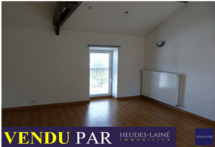
VENDU PAR HEUDES-LAINÉ IMMOBILIER