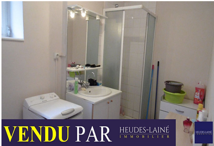
VENDU PAR HEUDES-LAINÉ IMMOBILIER