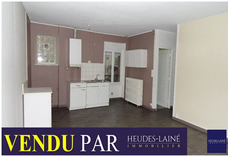
VENDU PAR HEUDES-LAINÉ IMMOBILIER