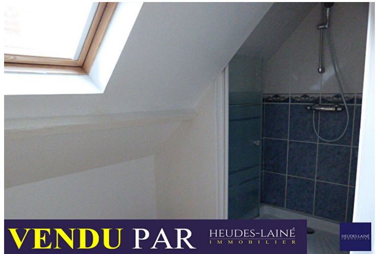
VENDU PAR HEUDES-LAINÉ IMMOBILIER