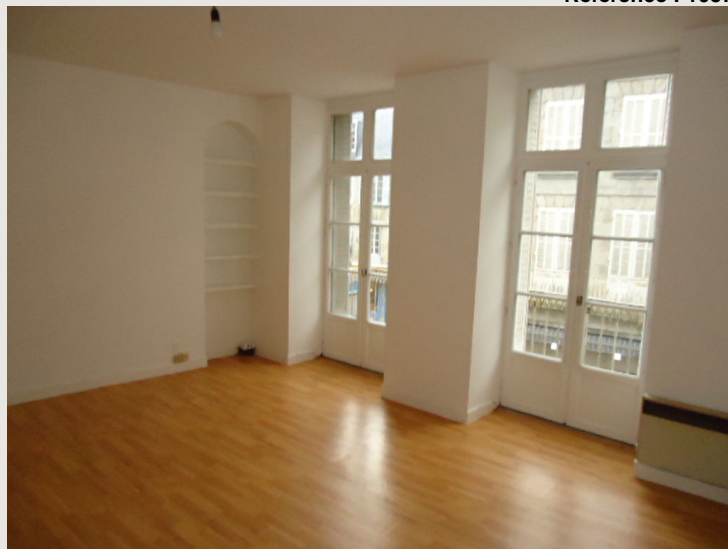
Appartement une chambre, séjour, avec balcon, centre ville Aubusson

Provisionnelles mensuelles avec régularisation annuelle